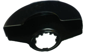
Protective guard for cutting. (Not included in the equipment.)-