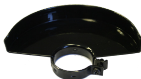
Zaščitni pokrov za brušenje.

*Prikazan ali opisan pribor ne spada v standardni obseg dobave.