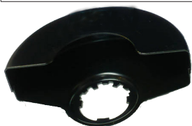
Zaštitna hauba za presecanje.*