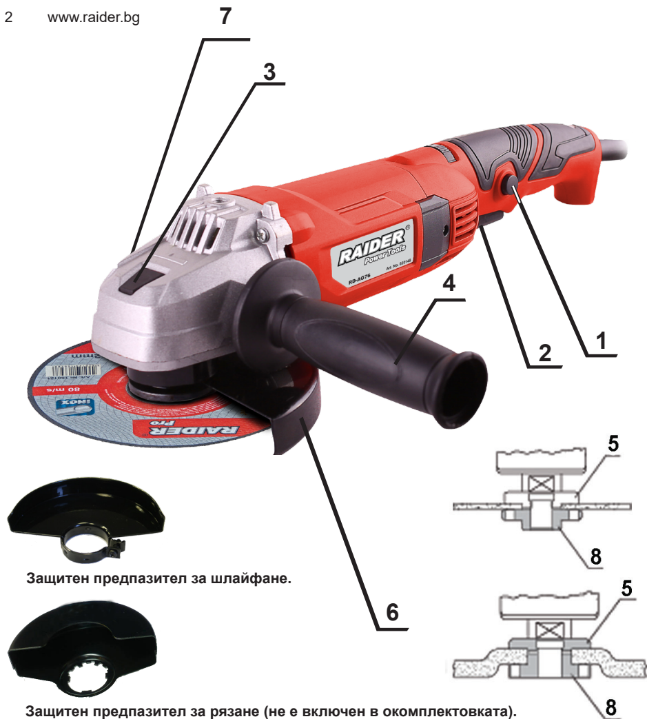
Защитен предпазител за шлайфане.