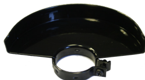
Заштитен осигурувач за брусење.

Внимателно прочитајте ги упатствата за употреба пред работа за да го намалите ризикот од повреди.